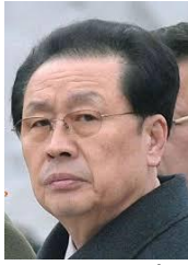
Jang Song Taek

I midten af december sidste år var Nordkorea igen en topnyhed i medierne. Denne gang på grund af nyheden om dødsdommen over og henrettelsen af den tidligere højtplacerede leder Jang Song Taek. Hvad er kendsgerningerne i denne sag?