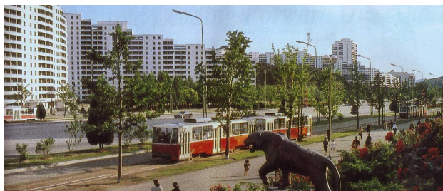
Kwangbokgaden i Pyongyang, hvor varmforsyningen på forsøgsbasis kommer fra solenergi.

I bestræbelserne for at overvinde den kroniske energikrise i DDF Korea vil landets regering forsøge at skærpe den videnskabelige forskning i energiudvikling. Det fremgår af en artikel i det koreanske mindretals avis Choson Sinbo i Japan den 22. marts 2014. Ifølge Choson Sinbo skal forskere fra DDF Koreas Nationale Videnskaberens Akademi bidrage til at reducere kulforbruget til energifremstillingen ved at udvikle og implementere brugen af biomassebrændsel i flere fabrikker i Pyongyang.