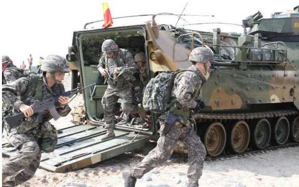
Amerikanske soldater øver sig i landgang under Foal Eagle krigsøvelsen i Sydkorea.

I perioden 24. februar til 18. april afholdtes en række store krigsøvelser i Sydkorea under USA's ledelse □ Danmark sendte 4 flådeofficerer med.