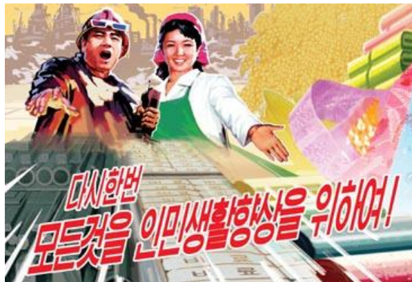
Plakat i nordkoreansk fabrik, der opfordrer arbejderne til at øge produktionen gennem forøget engagement, ansvarlig og innovation og Socialistisk Produktionskonkurrence □

Den koreanske mindretalsavis i Japan Choson Sinbo skrev den 2. april, at det nye økonomiske system i DDF Korea med større autonomi til mange virksomheder har givet økonomisk fremgang. I artiklen hed det også, at nordkoreanske virksomheder som noget nyt har fået mulighed for fravige en overordnet national økonomisk plan og i stedet at producere og sælge deres produkter efter eget skøn. Dertil kommer, at de der er med i ordningen, har mulighed for at betale ekstra bonus til de ansatte arbejdere afhængig af virksomhedens økonomi.