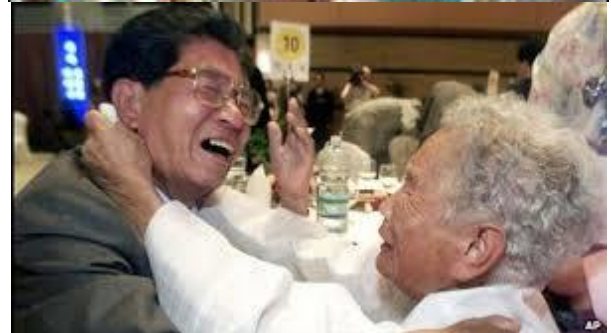
Scener fra gensyn af nord- og sydkoreanske familiemedlemmer i Kumgangs an efter over 60-års adskillelse

Efter langvarige og ind imellem sammenbrudte forhandlinger lykkedes det for Røde Kors i Nord- og Sydkorea at gennemføre gensyn for familiemedlemmer og slægtninge fra Nord- og Sydkorea, der ikke har hørt fra, eller set hinanden i over 60 år siden den kaotiske adskillelse under Koreakrigen i begyndelsen af 1950'erne.