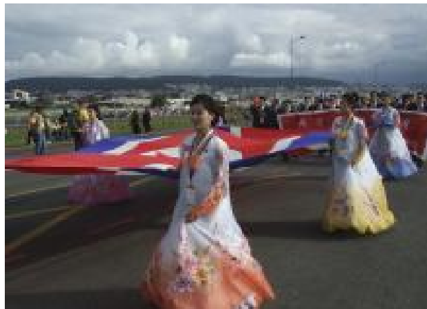
Medlemmer af den nordkoreanske delegation ses her ved indmarchen ved åbningen af Verdensfestivalen i Quito i Ecuador i december 2013.

Den 10. december 2013 åbnede den 18. Verdensfestival for ungdom og studerende i Ecuadors hovedstad Quito. Ved åbningsindmarchen deltog delegationer fra 83 lande □ heriblandt fra Den Demokratiske Folkerepublik Korea. I sin åbningstalen opfordrede den ecuadorianske præsident Rafael Correa bl.a. alle progressive unge verden over til at gå i spidsen for at stoppe og forhindre imperialismens forsøg på underminering af verdens anti-imperialistiske og uafhængige lande.