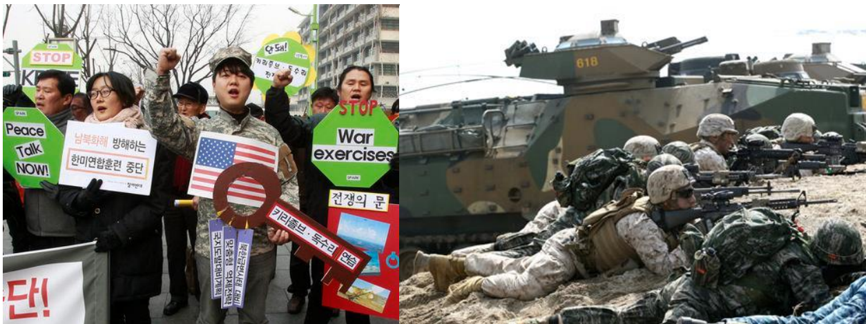
Protester i Seoul imod USA's tilbagevendende og farlige krigsøvelser i Sydkorea