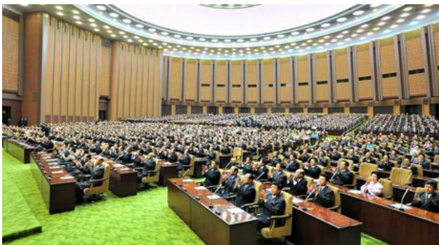
Fra mødet i Den Øverste Folkeforsamling den 9. april 2014.

Tilstede som observatører var repræsentanter for Koreas Folkehær og andre væbnede styrker, offentlige organisationer, ministerier og repræsentanter indenfor områderne videnskab, uddannelse, undervisning, kunst, sundhed og medier.