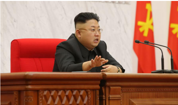
DDF Koreas leder kammerat Kim Jong Un

Kammerat Kim Jong Un holdt den 1. januar 2014 sin nytårstale, der gav en opsummering af året 2013 og opgaverne og udfordringerne i 2014. Talen omtales her i korte uddrag.