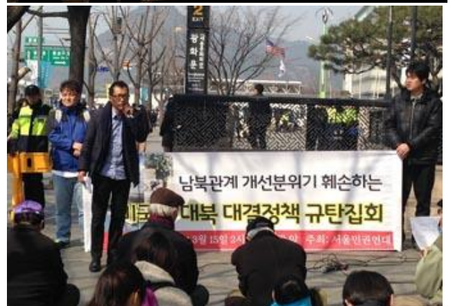
Fra protestdemonstrationer i Seoul mod de USA-ledele krigsøvelser.