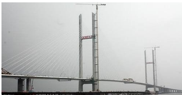
Ny højbro under opførsel mellem DDF Korea og Kina over Amnokfloden vidner om stærkt udvidet kinesisk-nordkoreansk samhandel og økonomisk vækst i DDF Korea.

DDF Korea og Cuba har etableret et tættere militært samarbejde, hvilket et højtstående besøg i Havana i juli 13 bevidnede.