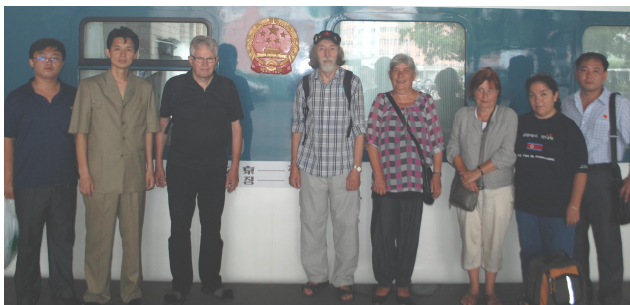
Venskabsforeningens delegation tager afsked med de koreanske værter på Pyongyangs hovedbanegård i juli 2013.

fredsmarch Pyongyang til Kaesong og Panmunjom, hvor venskabsforeningens delegation også deltog med medbragte bannere. Delegations medlemmer lærte samme med de mange andre fra venskabs- og solidaritetsorganisationen fra hele verden at råbe Chosonun hanada (Korea is one!) og Migun nagaga (US troops get out!).