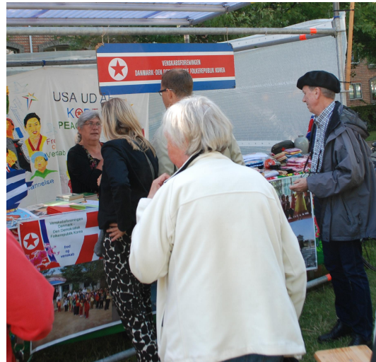
Venskabsforeningens velbesøgte bod hos K-Festival i august 2013 i Nørrebroparken i København.

Foreningen har derudover i løbet af året udsendt 6