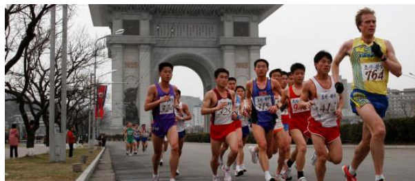
Internationalt maratonløb i Pyongyangs gader

Pyongyang lagde den 13. april 2014 sine smukke gader til et internationalt maratonløb med deltagere fra i alt 27 lande. I løbet deltog både amatører og professionelle. Langs ruten sås mange tilskuere, som heppede på de løbende. Flere hornorkestrer langs løbsruten sørgede også for musik til både deltagere og tilskuere.