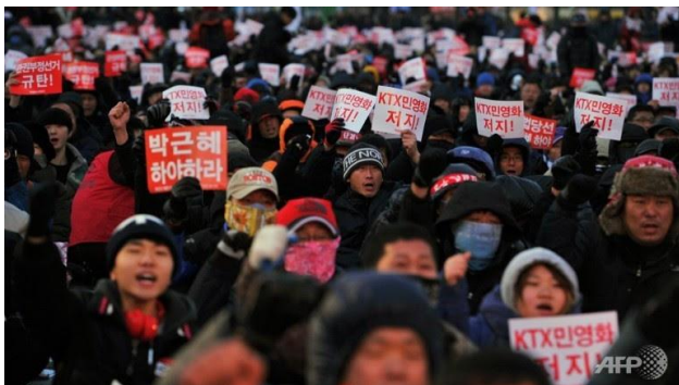
Fra protestdemonstrationen i Seoul den 27. december 2013 med over 100.000 deltagere.

Tusindvis af sydkoreanske jernbanearbejdere sluttede den 30. december 2013 den længste og mest omfattende jernbanestrejke i Sydkoreas nyere historie. Strejken lammede i over tre uger jernbanedriften i Sydkorea, og den var rettet direkte imod den konservative og fagforeningsfjendske præsident Park Geun Hye. Strejken begyndte den 9. december efter regeringen besluttede at privatisere det statsejede sydkoreanske jernbaneselskab Korail og fyrede over 4000 ansatte og annoncerede ansættelse af 660 strejkebrydere.