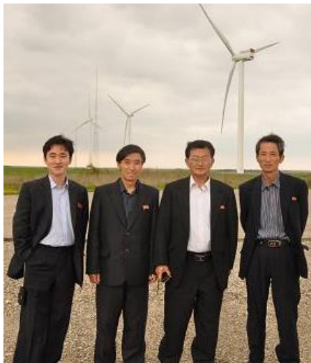
Den nordkoreanske PIINTEC-delegation ses her foran Høvsøre Teststation for store vindmøller beliggende lige nord for Nissum Fjord.

En gruppe på 4 grøn energi specialister fra Pyongyang International Information Centre of New Technology and Economy, forkortet til "PIINTEC", kom til Nordisk Folkecenter for at modtage undervisning i vedvarende energi i Danmark.