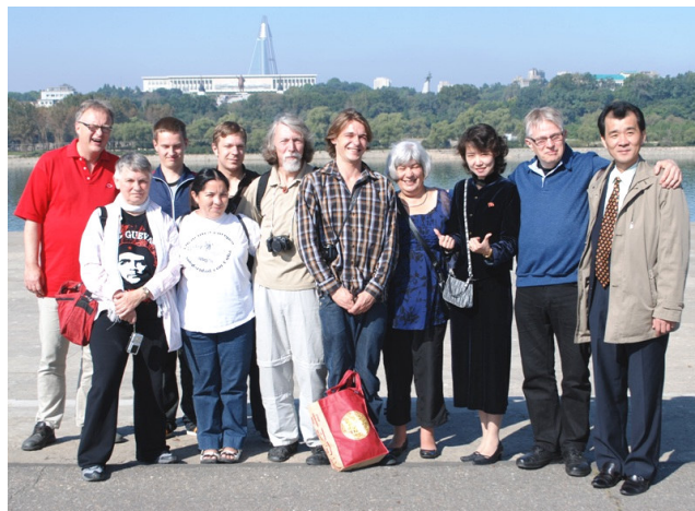
Venskabsforeningen delegation i Korea i oktober 2010.