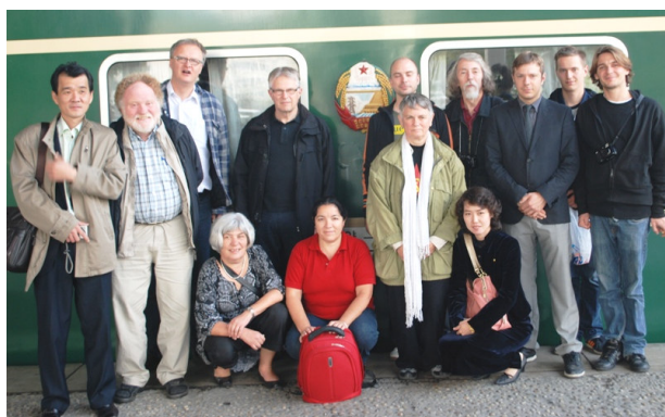
Venskabsforeningens delegation ved afrejsen fra Pyongyang i oktober 2010.