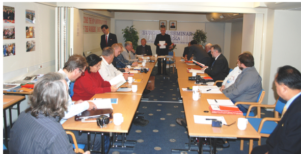
Fra Europæisk Koreaseminar i København oktober 2010

Det Europæiske Koreaseminar blev afholdt i anledning af 65-årsdagen for grundlæggelsen af Korea Arbejderparti