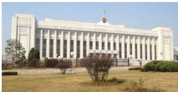
Den Øverste Folkeforsamling – DDF Koreas parlament.