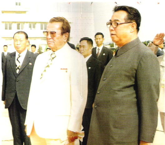
Præsident Kim Il Sung besøger Jugoslavien i 1975. Her ses han sammen med landets daværende præsident Tito Broz.

at stole på egne kræfter og egne erfaringer og nok skal man lære af andre, men ikke gøre sig afhængig af dem.