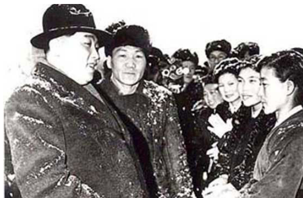
Præsident Kim Il Sung taler med arbejdere fra Chongjin Stålværk i 1959 i genopbygningsårene efter den altødelæggende Koreakrig.