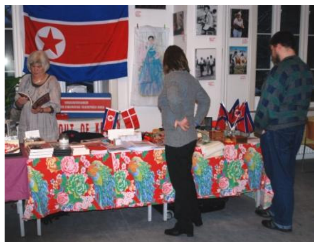
Fra Venskabsforeningens deltagelse i Verdensjulemarked i december 2010.