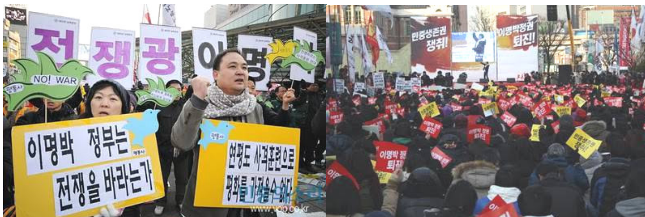
Sydkoreansk masseprotest i Seoul imod fortsatte krigsøvelser i Sydkorea, der truer freden i Korea.