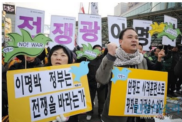
Fra masseprotesten i Seoul 18. december 2010.