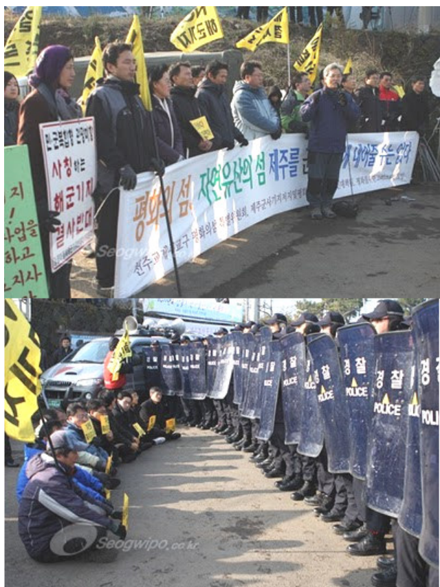
Beboere på Cheju blokerer her for betonbiler, der er på vej til byggepladsen for den nye flådebasen ved kystbyen Gangjeong.

Den 27. december 2010 protesterede en stor gruppe lokale beboere imod den påbegyndte opførelse af en ny flådebase på den store ø Cheju, som ligger lige syd for Koreahalvøen. Den sydkoreanske regering har tilskyndet af USA besluttet at bygge en helt ny flådebase i kystbyen Gangjeong på Cheju. Ifølge Global Network Against Weapons and Nuclear Power in Space bygges den nye flådebase fordi USA har planer om stationering af flere flådefartøjer i området for at dæmme op imod Kinas ekspanderende militære og økonomiske magt i området. Officielt skal basen bruges som led i forsvaret imod