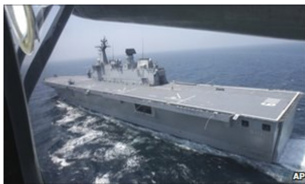
USS George Washington under flådekrigsøvelse i Korea i juli 2010.

Kendsgerningen er, at det sydkoreanske militær er dybt integreret i det amerikanske militær. I juli afholdt de to lande fælles ”øvelser” i de samme havområder ud for den koreanske halvøes vestkyst. Øvelsen omfattede 200 fly og 20 skibe, herunder hangarskibet ”USS George Washington”, der er udstyret med atomvåben.