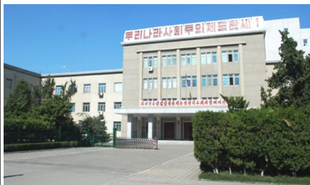
Kulturkomiteens hovedkvarter i Pyongyang.