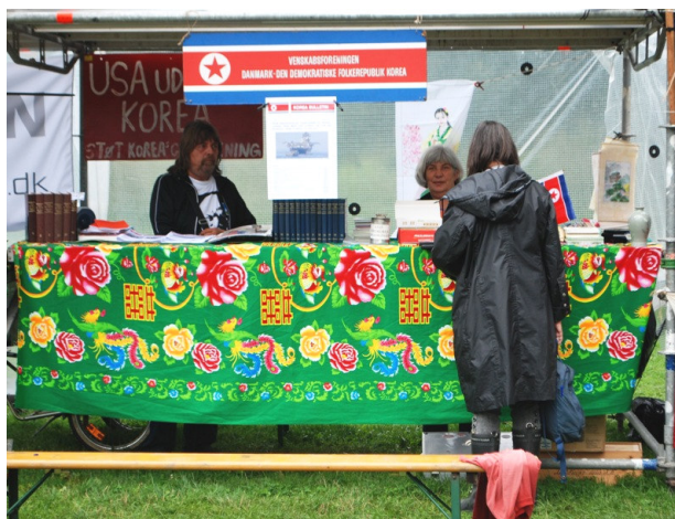
Venskabsforeningen på K-Festival august 2010.