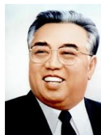
Præsident Kim Il Sung

Den 15. april 2011 ville DDF Koreas grundlægger Kim Il Sung være fyldt 99 år. Koreanerne kalder dagen for SOLENS DAG.