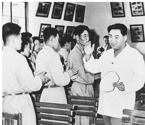
Præsident Kim Il Sung besøger en militær enhed i 1962.

Kammerat Kim Il Sung vil blive husket som en stor leder af den første uafhængige, socialistiske Korea igennem et halvt århundrede og som en stor anti-imperialist.