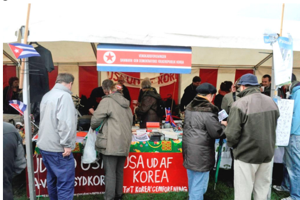
Venskabsforeningens bod på Rød 1. maj 2010.