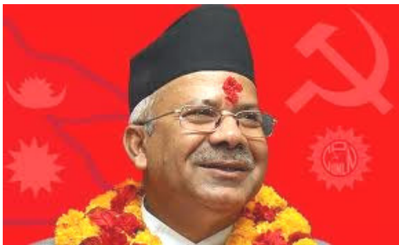
Madhav Kumar Nepal blev valgt som æresformand for Den Internationale Forberedelseskomite.

Mødet vedtog en hilsen til DDF Koreas leder kammerat Kim Jong Il og en erklæring om arbejdet med at forberede fejringen af præsident Kim Il Sung's 100-års fødselsdag frem til april 2012.