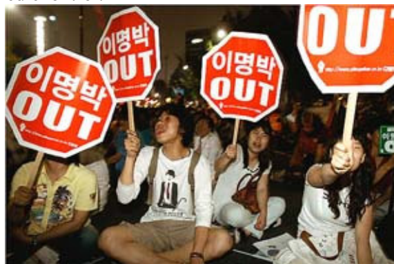
Fra demo i Seoul september 2008: UD MED LEE MYONG BAK!

Den nye ultrakonservative Lee Myong Bak regering bliver udsat for stadig større modstand fra befolkningen ved strejker og massedemonstrationer. Det skyldes bl.a. regeringens omfattende privatiseringer og liberaliseringer og åbning for import af amerikanske fødevarer. Mange befolkningsgrupper i Sydkorea er også utilfredse med at det hemmelige politis overvågninger er betydeligt skærpet og der er indført en kraftig mediekontrol.