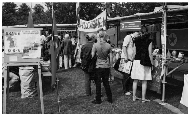
Fra Venskabsforeningen velbesøgte store dobbelt-bod hos K-Festival i Nørrebro-parken i København i august 2008.

Et andet af årets højdepunkter for Venskabsforeningen var besøg i Korea med en rekordstor venskabsdelegation på 11 medlemmer. Delegationen deltog i et særdeles spændende og varieret besøgsprogram, hvori indgik deltagelse i