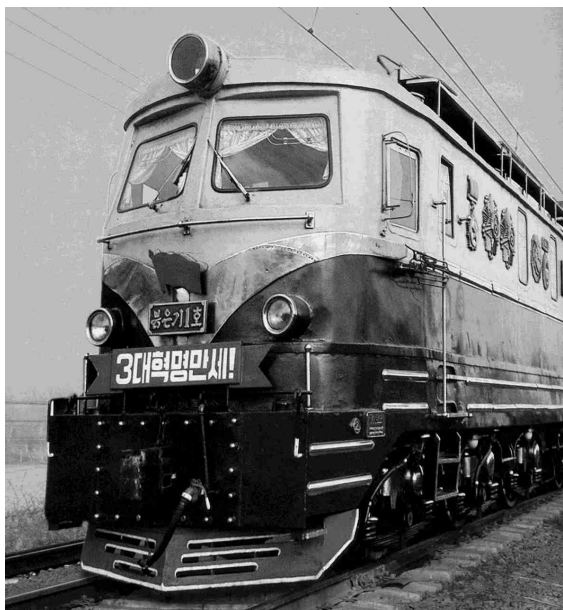
Røde Fane Lokomotiv Nr. 1 i Nordkorea på vej til Pyongyang med Venskabsforeningens delegation i 2008