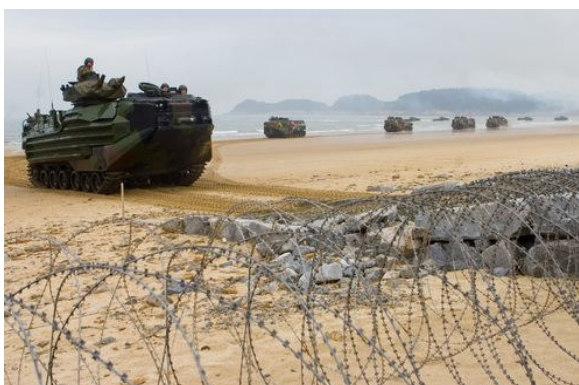
Fra amerikansk-syd-koreansk invasions landgangsøvelse vendt imod DDF Korea i marts 2008

Japan, der burde smides ud. Det sker med henvisning til, at Japan konstant fremsætter ukonstruktive aggressive forslag, der forgifter 6-partsprocessen. Formanden henviste til, at det ikke gjorde forholdet bedre, at Japan fortsat behårdt opretholder skibsblokade mellem DDF Korea og Japan og omfattende handelssanktioner, samt er i gang med en oprustning vendt imod DDF Korea. Oven i dette udsættes den koreanske mindretalsorganisation CHONGRYUN og dets medlemmer af flere undertrykkende politiske og racistiske overgreb fra myndighederne i Japan og højreradikale gruppen, som myndighederne vender det blinde øje til.