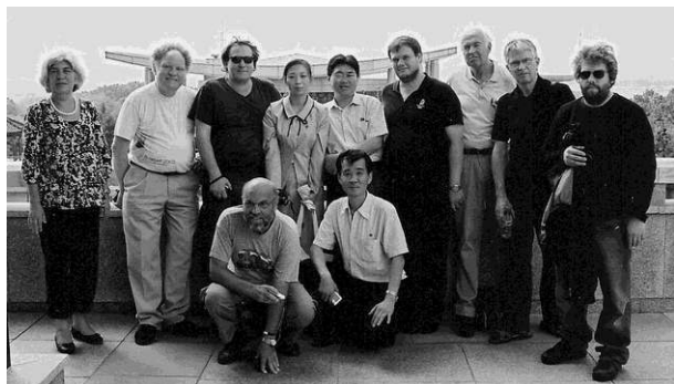
Venskabsforeningens delegation ses her på besøg i Panmunjom på grænsen mellem Nord- og Sydkorea.

fra rejsen, som kan købes hos Venskabsforeningen for 50 kr. til fordel for Nordkoreainsamlingen.