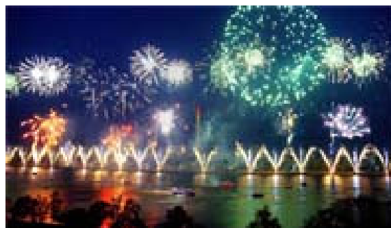
Præsident Kim Il Sung's 97 årsdag blev fejret med et kæmpefyrværkeri i Pyongyang 14. april 2009