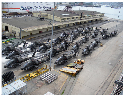
Amerikanske Apache AH-64 kamphelikoptere ankommer her til Pusan Havn i Sydkorea 11. marts 2009 under Foal Eagle krigsøvelsen.

Koreas Folkehær udsendte den 9. marts 2009 en kommentar til de forestående amerikansk-syd-koreanske krigsøvelser Key Resolve og Foal Eagle. KOREA BULLETIN bringer her et forkortet uddrag fra kommentaren: