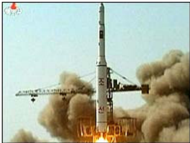
Unha-2 raket med Kwangmyongsong-2 satellit opsendes her fra DDF Korea den 5. april 2009.