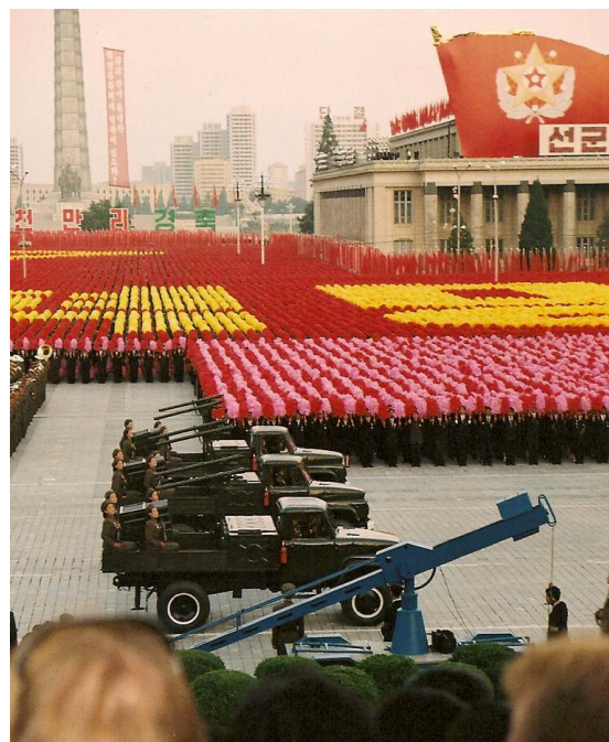
Lille udsnit af den store parade på Kim Il Sung-pladsen i anledning af DDF Koreas 60 årsdag 9. september 2009. Venskabsforeningens delegation var inviteret på 1. parket.

festlighederne i anledning af DDF Koreas 60-årsdag med stor parade og fakkeloftog samt specialopførsel af Arirang-forestillingen med 100.000 optrædende. Et andet højdepunkt var besøg hos foreningens venskabslandsby Unha-ri, hvor der blev afleveret gaver for en værdi af 15.000 kr. til landsbyens børnehave og landbrugskooperativ fra Nordkoreainsamlingen.