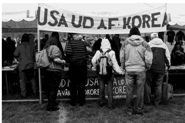
Fra Rød 1. maj 2008 i Fælledparken i København

Derudover har foreningen afholdt 3 medlemsmøder i året. Og med hensyn mere udadvendte aktiviteter kunne formanden notere, at foreningen havde fulgt traditionen med deltagelse i Verdensjulemarked i december 07, deltagelse hos Rød 1. Maj og K-Festival i august 08 alle i København. Han fremhævede, at det fortsat er godt med Rød 1. majs nye placering i Fælledparken, hvor vi kommer i kontakt med langt flere mennesker ved foreningens bod end ved tidligere placering.