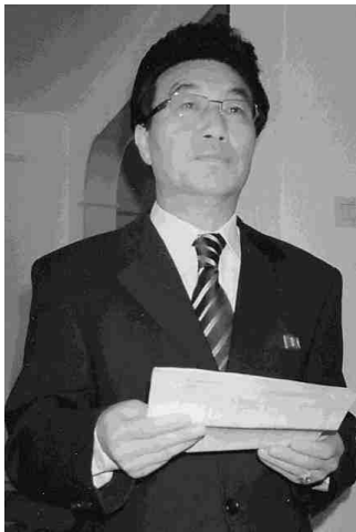
Ambassadør Ri Hui Chol

Torbjörn Björkman fra det svenske KOREA INFORMATION har interviewet DDF Koreas ambassadør i Stockholm Ri Hui Chol. Ambassaden i Stockholm betjener Koreas diplomatiske forbindelser med alle de 5 nordiske lande.