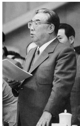
Præsident Kim Il Sung

Den 15. april 2009 ville DDF Koreas grundlægger Kim Il Sung være fyldt 97 år. Koreanerne kalder dagen for SOLENS DAG.