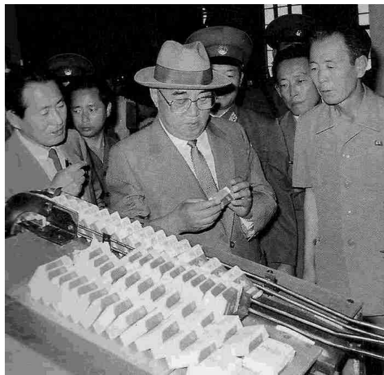
Præsident Kim Il Sung giver vejledning på stedet på fødevarerfabrik Hoeryong i 1991.

Kammerat Kim Il Sung var hele sit liv, ikke kun optaget af forsvaret for og opbygningen af DDF Korea, men også at der skal findes en løsning på den ulykkelige deling af hele den koreanske halvø og USA militære besættelse af Sydkorea. Han fremsatte derfor igennem årene utallige forslag til hvordan Korea kunne blive genforenet uden fremmed indblanding og med fredelige midler. Og forslag til af sikring af varig fred i Korea og tilbagetrækning af USA's tropper og masseødelæggelsesvåben i Sydkorea. De mest kendte forslag er det fra 1980 om dannelse af en Nord-Sydkoreansk konføderation og hans 10-punktsprogram for genforening fra 1993. Vigtige elementer af disse forslag er indskrevet i Nord-Syd Fælleserklæringen, der blev indgået af Kim Il Sung afløser kammerat Kim Jong Il og Sydkoreas daværende præsident Kim Dae Jung i 2000 på det historiske Nord-Syd topmøde i Pyongyang. En fælleserklæring, som er i fuld gang med at blive implementeret i Korea, og som blev fulgt på et nyt Nord-Syd topmøde i Pyongyang i oktober 2007 med indgåelsen af Fælleserklæringen For Udvikling af Nord-Syd Relationer og for Fred og Fremgang underskrevet af kammerat Kim Jong Il og Sydkoreas daværende præsident. Men erklæringer og processer, som samtidig trues alvorligt af Bush-