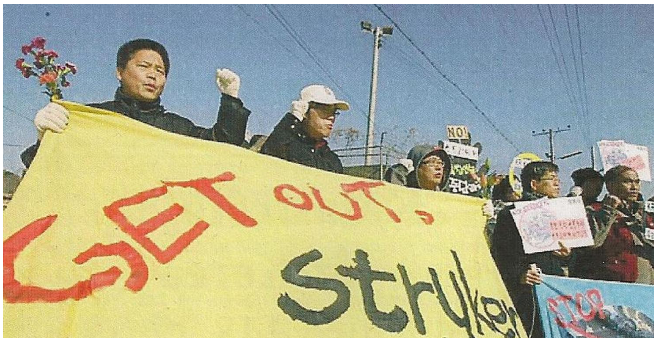
Protest i Sydkorea imod den amerikansk-sydkoreanske krigsøvelse Key Resolve i marts 2009. Øvelsen truede Nordkorea med overraskelsesangreb og invasion med både konventionelle moderne våben og atomvåben.