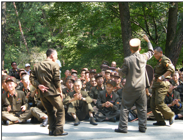
Scene fra TUREN TIL NORDKOREA. Venskabsforeningens delegation møder tilfældigt en stor gruppe nordkoreanske soldater på skovtur i Myohyangbjergene. Senere i filmen synger soldaterne og danskerne sammen Internationale.

Filmen TUREN TIL NORDKOREA kan købes hos Venskabsforeningen for kun 50 kr. plus porto. De 50 kr. går til Nordkoreaindsamlingen.