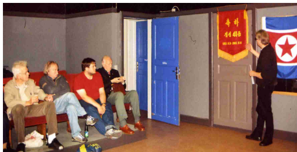
Fra Venskabsforeningens 40-års jubilæumsreception den 10. oktober 2008 i Christianshavns Beboerhus i København.

holdt taler i anledning af dagen. På festmødet blev DDF Koreas 60-årsdag naturligvis også fejret. Dernæst blev foreningens 40-årsdag fejret på selve dagen den 10. oktober 2008 ved en reception og filmforevisning i København.