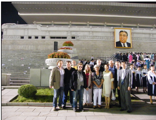
Scene fra TUREN TIL NORDKOREA. Venskabsforeningens delegation på Kim Il Sung-pladsen efter paraden 9. september 2008.