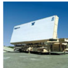
Israelske Green Pine radaranlæg

Den 17. februar 2009 besluttede Sydkoreas regering at indkøbe for 215 mill. US $ Green Pine-radarsystemer i Israel. Sydkorea købte i 2008 for ca. 1,25 mia. US $ krigsfly og andre våben i Israel.