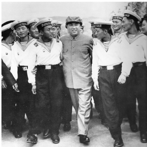
Præsident Kim Il Sung besøger en enhed fra Koreas Folkehærs flåde i juni 1968.

Ledetråden i denne enestående revolutionære opbygning var Juche-ideen, som blev formuleret af kammerat Kim Il Sung. Juche-ideen betyder i den korte udgave betyder, at stole på egne kræfter og egne erfaringer og nok skal man lære af andre, men ikke gøre sig afhængig af dem.