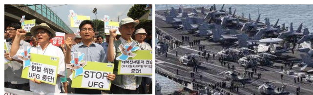
T.v. ses demonstration imod krigsøvelsen Ulji Freedom Guardian (UFG) i Seoul. T.h. ses det amerikanske hangarskib George Washington, der deltager i krigsøvelsen.

Den 13. august 2014 blev den USA-ledede krigsøvelse Ulji Freedom Guardian skudt i gang i Sydkorea. Det skete til trods for, at DDF Korea flere gange i løbet af sommeren havde opfordret til en suspension af krigsøvelsen, der medfører en betydelig skærpelse af konflikten og konfrontationen på den koreanske halvø. I stedet for krigsøvelser og gensidig fjendtlighed er der brug at genoptage en Nord-Syd inter-koreanske dialog om forsoning og samarbejde, skrev DDF Koreas Nationale Fredskomite i en erklæring den 1. august i et sidste forsøg på at få krigsøvelsen aflyst.