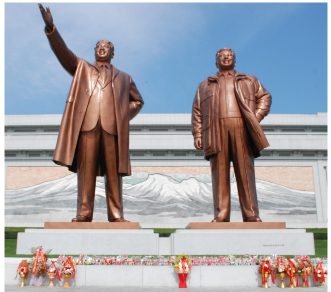
Statuerne af præsident Kim Il Sung og kammerat Kim Jong Il.

Om eftermiddag er der arrangeret gaveoverrækkelse fra Venskabsforeningen til landets leder kammerat Kim Jong Un. Det er der tradition for. Gaven overrækkes dog ikke direkte, men gennem lederen af