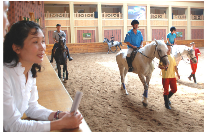
Fra den store ridehal i Mirim Ride Center.

På vores vej rundt i Pyongyang kan jeg konstatere stor byggeaktivitet mange steder. F.eks. er de udvendige sider af det gigantiske pyramidehotel Ryoryong nu endelig færdige, og den indvendige del er også godt i gang. Hotelbyggeriet er for to år siden overtaget af et ægyptisk-koreansk konsortium, men byggeriet trækker ud, da man også her mærker blokaden og har svært ved at købe den moderne teknologi, som et nyt hotel kræver.