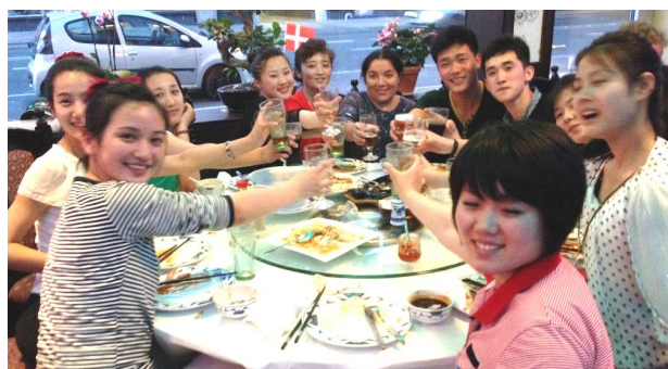
Afskedsmiddag med Venskabsforeningen på en kinesisk restaurant.