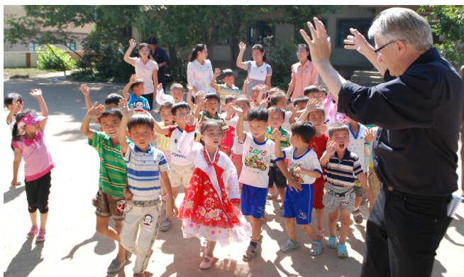
Der tages igen afsked med børnene i Unha-ri.

grund af et stramt tidspres i dagens program bliver der ikke tid til at komme ind i børnehaven denne gang. Jeg tager igen afsked med børnene og personalet. Vi har tidligere i Korea Bulletin skrevet om denne børnehave.