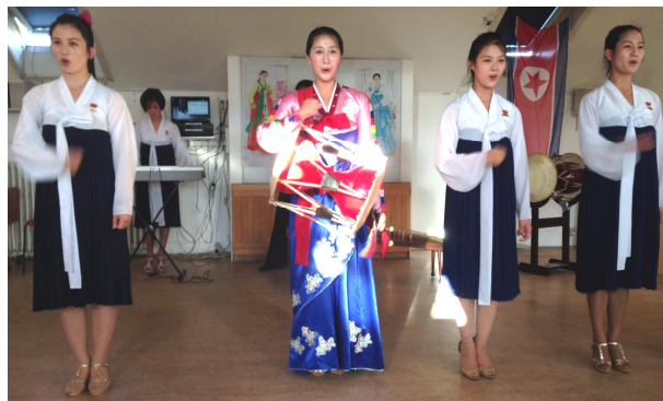
Fra optræden i Venskabsforeningen den 18. juni i Verdenskulturcentret i København. Nu er vi blandt venner og skal ikke være □upolitiske□ Kim Jong Il-sangen kan synges med knyttede næver og Kim Il Sung-badges er på tøjet igen.