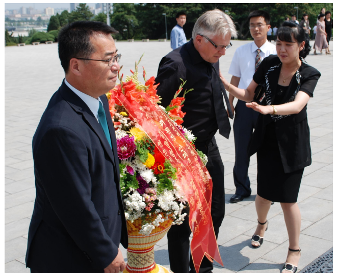
Der gives her instrukser i hvordan blomsterkurven skal stå foran bronze statuerne.