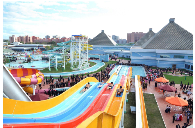
Fra Munsu Vandland i Pyongyang.

Onsdag den 9. juli om formiddagen besøger vi det ny anlagte store Munsu Vandland Center i Daedonggangbydelen. Jeg bliver guided af en ung mand, der taler godt engelsk. Han forklarer, at det store vandland blev indviet i oktober sidste år og er en gave fra Koreas Arbejderparti til befolkningen. Vandlandet er tydeligvis meget populært. Folk står i kø for at komme ind. Mange børn har baderinge med. Centret har i alt 18 svømme- og badebassiner – 8 af dem indendørs. Der er bassiner i alle størrelser og dybder inkl. babybadebassin og mange af dem er forsynet med fantasifulde rutsjebaner til stor glæde for især børnene. Nogle rutsjebaner er bygget ind i kunstige bjerge og nogle er forsynet med små gummibåde. Arealet udgør 125.000 m 2 – heraf 16.000 m 2 indendørs. Der kommer dagligt ca. 7-8000 besøgende og maksimum er 10.000. På grunden findes også et rekreativshjem for højgra-