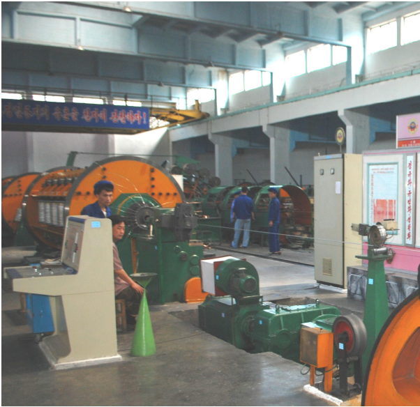
Fra Pyongyang Kabelfabrik nr. 326.