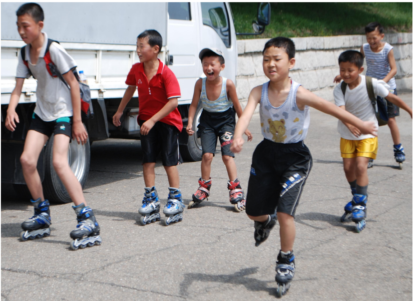
Hverdagsbillede: Drengene på rulleskøjter efter skoletid langs Daedongfloden i Pyongyang.