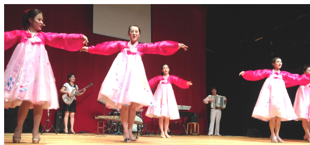
Fra optræden i Betty Nansens Teatret på Frederiksberg.