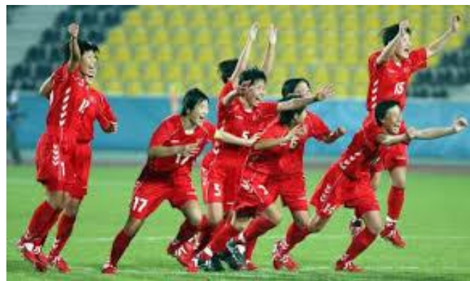
DDF Koreas U20 kvinde fodboldslandshold.

Efter dette bulletins deadline har DDF Korea spillet sine tre indledende kampe ved kvindernes U20-forbøld VM i Canada. Det gælder nøglekampene mod Finland og Ghana i Toronto den 5. og 8. august 2014, samt det svære opgør med værtsnationen på det olympiske stadion i Montreal den 12. august.