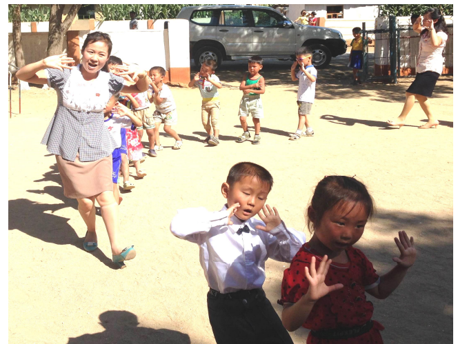
Børnene i Unha-ri optræder med dans og sang til ære for den besøgende fra Danmark. Her ses børn fra Venskabsforeningens venskabsbørnehave.

Vi tager sammen hen og besøger Unha-ri's børnehave. Både landbrugskooperativet og børnehaven har venskabsstatus med Venskabsforeningen. Her modtages jeg af glade børn, der kommer mig løbende i møde. Jeg har en samtale med lederen og overrækker fra Venskabsforeningen poser med brød, kager og andre søde sager samt en del plastiklegetøj. Herefter optræder børnene og pædagogerne med en række danse- og sanglege på pladsen foran børnehaven. På