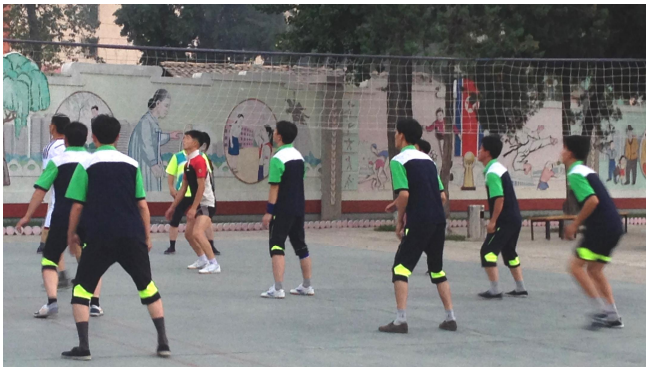
Street volleyball i Yonggwong Street i det centrale Pyongyang.

Om aftenen gik jeg en tur i skumringen, hvor temperaturen er mere udholdelig. Hvis man går langsomt, så kan man iagttage mange ting. Børn, der leger, kærestepar, der hygger sig, og drenge på rulleskøjter. I Yonggwong Street i Central District er der et leben i en park bag ved nationalscenen. Her spilles alle slags boldspil og folk går aftenstur i parken. Butikkerne ser lukkede ud, da lyset er slukket, men hvis man ser nærmere efter, så er der masser af liv i de fleste butikker. Man sparer på strømmen. Der findes også flere udsænkingssteder. Man skal dog se godt efter, da der også her er meget lidt lys og der er slet ingen reklamer eller skilte, der viser hvad slags butik eller bar, som findes bag ruderne.