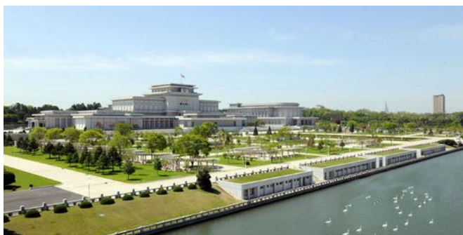
Kumsusanpaladset med folkepark foran.

Næste morgen den 8. juli er rejsens højdepunkt. Det er i dag nøjagtigt 20 år siden præsident Kim Il Sung døde. Der er afgang fra hotellet kl. 7.00 præcis. Vi skal, trods varmen, alle stille i det stiveste puds - skorte, slips, jakke og lukkede mørke sko. Kl. 8.00 præcis skal vi sammen med en masse andre udlændinge og koreanere aflægge besøg i Kumsusanpaladset. Det er et kæmpe mausoleum, hvor både præsident Kim Il Sung og tidligere leder kammerat Kim Jong Il balsamerede legemer befinder sig i et i hver sit gravkammer i hver sin glassarkofag. Paladset var tidligere Kim Il Sung's præsidentpalads.