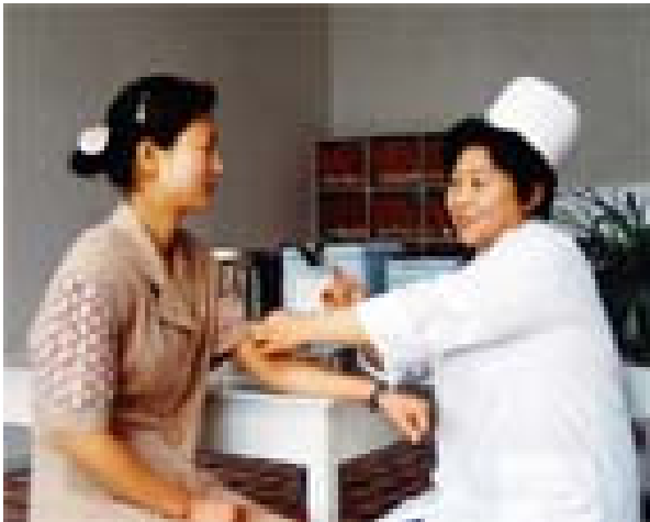
Læge foretager forebyggende undersøgelse i en poliklinik på et landbrugskooperativ.

Selvom DDF Korea har været igennem meget svære tider med naturkatastrofer, hungersnød, sammenbrud i tidligere samhandelsforbindelser og blokade og krigstrusler fra USA, så er det socialistiske sundhedssystem, som blev opbygget i 1960'erne og 1970'erne, stadig intakt.