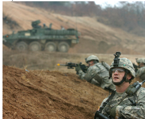
US troops i aktion i Sydkorea i Ulji Focus Lens-krigsøvelsen sidste år. Øvelserne har været årligt tilbagevendende siden 1975.

Ulji Focus Lens i Sydkorea. Øvelsen finder sted 11 dage i slutningen af august 2007 under ledelse af USA og med deltagelse af 10.000 amerikanske soldater ekstra foruden de ca. 40.000 der permanent er stationeret i Sydkorea. Øvelsen er vendt imod Nordkorea. DDF Koreas regering kaldte den kommende øvelse for en helt uacceptabel provokation, der alvorligt truer den videre proces i 6-partsaftalens implementering. Fra DDF Korea hed det, at det nu kan blive nødvendigt med en yderligere ”styrkelse af vores afskrækkelsesvåben.” På grund af krigsøvelsen aflyste DDF Korea samtidig sin deltagelse i et officielt Nord-Syd arrangement i Seoul den 15. august i anledning af befrielsesdagen (befrielsen fra Japans besættelse i 1945).