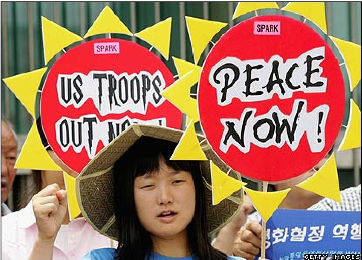
US TROOPS OUT NOW. Fra en stor fredsdemonstration i Seoul 31.juli 2007. Ud over dette krav forlangte demonstranterne også, at Sydkorea trækker sine tropper ud af Afghanistan omgående.