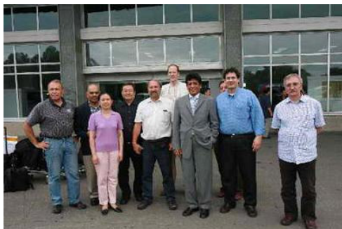
Delegationen fra IAEA ankommer her til Nyongbyon for at påbegynde inspektionen af nedlukningen af atomkraftværket.

Den 14. juli 2007 lukkede teknikere på Nyongbyon-atomkraftværket alle værket anlæg ned. Det skete under overvågning af inspektører fra Det Internationale Atomenergiagentur (IAEA). Fra IAEA hed det, at nordkoreanerne havde været meget samarbejdsvillige og overholdt alle aftaler. Nedlukningen skete som led i gennemførelse af første fase af den igangværende sekspartsaftale af 13. februar 2007.