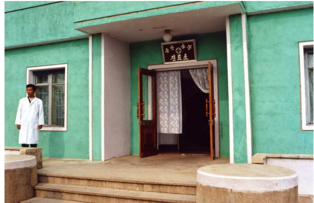
Poliklinikken i Sunan Statsfarm

Under den alvorlige krise i 1990'erne med fødevarer- og medicinmangel og hungersnød, så forblev strukturen i sundhedssystemet intakt. Dette var til stor nytte, da internationale nødhjælpsorganisationer som Røde Kors og WHO og WFP satte ind sammen med de koreanske sundhedsmyndigheder med nødhjælpeprogrammer i landet.