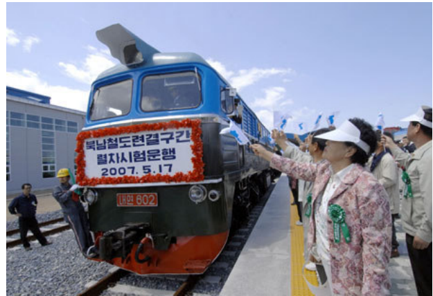
Det nordkoreanske tog ankommer til den sydkoreanske by Jejin den 17. maj 2007.