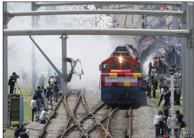
Det sydkoreanske tog afgår her fra Munsan i Syd på vej over demarkationslinien til Kaesong i Nord.