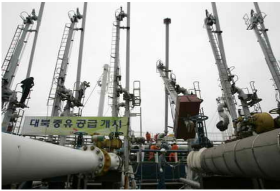
Første skibsladning af kompensations-råolie ankommer her fra Sydkorea til en nordkoreansk havn.

DDF Koreas regering udsendte samme dag en erklæring, hvori man konstaterede, at man havde udført sine forpligtelse i første fase af sekspartsaftalen fra februar. Nu afhang det videre forløb, ifølge en regeringstalsmand, så af at de 5 andre parter skulle færdiggøre og udføre deres forpligtelser efter princippet skridt-for-skridt. Og her har USA og Japan en særlig forpligtelse til opgive deres meget fjendtlige Nordkoreapolitik, der på alle måder lægger gift for det videre proces.