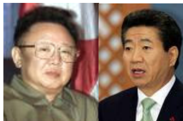
DDF Koreas leder kammerat Kim Jong Il (til venstre) og Sydkoreas præsident Roh Moo Hyun (til højre) mødes til topmøde i Pyongyang i slutningen af august 2007.

Lige inden deadline på augustnummeret af Korea Bulletin har redaktionen modtaget meddelelse om, at regeringerne i henholdsvis Den Demokratiske Folkerepublik Korea og Republikken Korea (Nord- og Sydkorea) er blevet enige om at afholde det andet Nord-Syd topmøde i Pyongyang i dagene 28.-30. august 2007. I disse dage vil Sydkoreas præsident og en større delegation besøge DDF Korea og mødes DDF Koreas leder kammerat Kim Jong Il og andre højtstående repræsentanter for Koreas Arbejderparti, regeringen, hæren og forskellige organisationer.