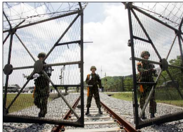
DMZ-porten mellem Nord- og Sydkorea åbnes for første gang for jernbanetrafik, men kun for en enkelt dag den 17. maj 2007. Sydkoreanske soldater åbner her porten for det nordkoreanske tog på dets vej sydpå.