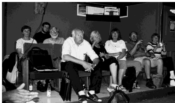
Et udsnit af mødedeltagerne på det offentlige debatmøde i Venskabsforeningen den 13. juni 2007.