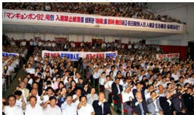
Fra CHONGRYUN's protestmøde i Tokyo den 11. juli 2007.

Det koreanske mindretals hovedorganisation i Japan CHONGRYUN afholdt den 11. juli 2007 et stort protestmøde imod Japans regering. Det skete i anledning af, at den japanske Abe-regering for tiden søger ulovligt at beslaglægge CHONGRYUN's hovedkvarter i Tokyo. Japans regering har i længere tid kørt en anti-CHONGRYUN og anti-DDF Korea smædekampagne i Japan med det formål, at sætte den japanske befolkning op imod det koreanske mindretal og undergrave organisationen. CHONGRYUN kæmper for det koreanske mindretals rettigheder og støtter aktivt DDF Korea og kampen for en uafhængig og fredelig genforening af Korea.